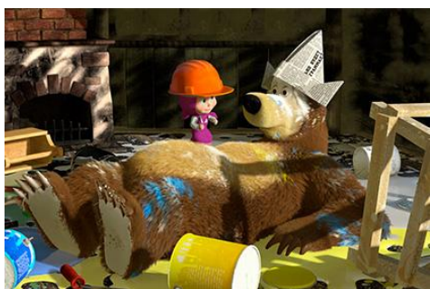
Рис.1. Маша и Медведь

6. Можно ли поступки героев брать в качестве примера.